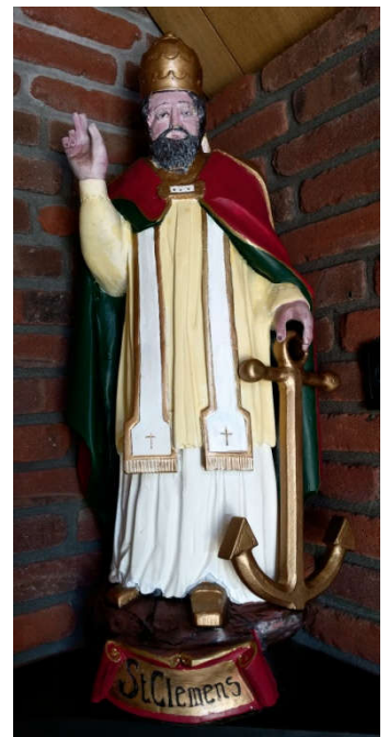
Inzegening Beeld Heilige Clemens Hulsel op pag. 2