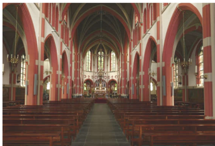
Interieur O.L.Vr.Tenhemelopneming in Reusel