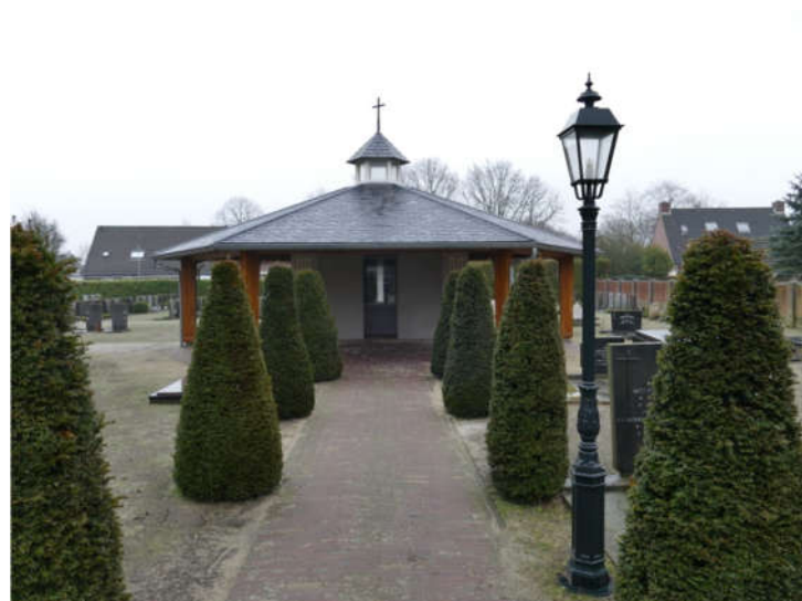
Aanzicht vanaf de grote toegangspoort ...