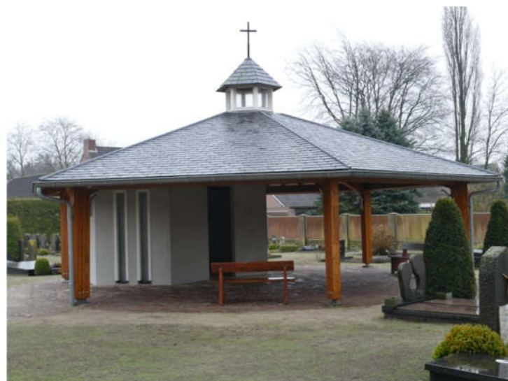
Zij aanzicht vanaf de kerk ...

De ruwbouw is klaar, rest nog de afwerking en het inrichten van de kapel de komende periode.